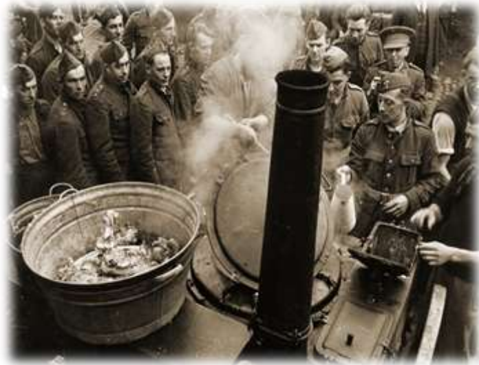
Carabiniers rond een veldkeuken.

Het 1C hervat de mars vanaf 13u30. Om het risico op ontdekking door vijandelijke vliegtuigen te minimaliseren, worden de pelotons één per één op weg gezet om via Westmeerbeek het dorp Booschot te bereiken. Kolonel Oor verlaat Westerlo en installeert zijn commandopost op deze nieuwe locatie.