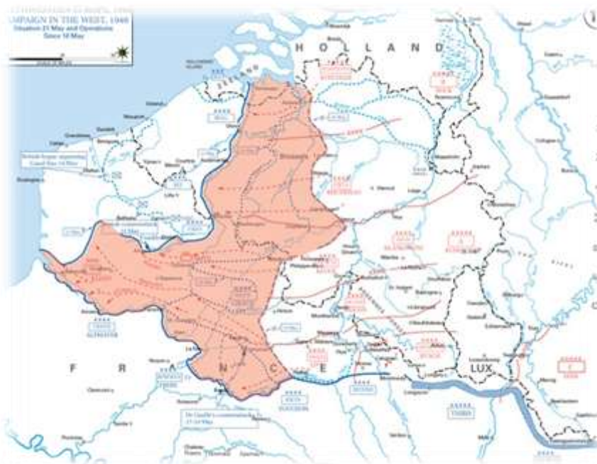
Duitse opmars van 16 mei tot 21 mei 1940