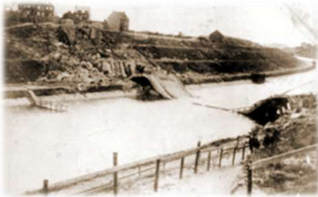
Vernielde brug van Briegden met BH2 op de achtergrond.

Het 2C is niet langer in staat zijn ondersector te verdedigen tegen de Duitse overmacht. Talrijke stellingen van de Karabiniers worden omsingeld en honderden militairen worden gevangen genomen. De resterende manschappen van het 2C beginnen hun stellingen te verlaten en trekken zich terug in te richting van de naburige 4de infanteriedivisie. Het Iste bataljon en een gedeelte van het IIde bataljon vluchten weg richting Mopertingen en Eigenbilzen en verzamelen om 13u00 op bevel van de korpscommandant in het bos te Hoelbeek. Van daaruit wordt rond 18u00 verder getrokken naar Hoeselt. De vijand is echter al zo ver doorgedrongen dat heel wat Belgen gegrepen worden door Duitse troepen op de weg naar Hoeselt langsheen de baan Tongeren-Bilzen.