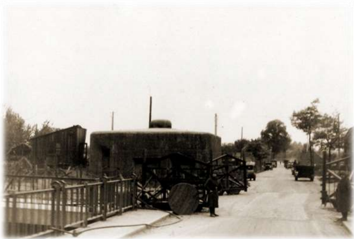
Bunker N aan de brug van Veldwezelt.

Het IIde bataljon heeft drie compagnies in lijn opgesteld, de 6Cie bewaakt de brug van Veldwezelt, de 5Cie de brug van Briegden en de 7Cie is langs het kanaal opgesteld tussen de twee bruggen in. Hierdoor beschikt het bataljon over geen enkele reserve om offensief op te treden indien de linies doorbroken worden. De bunker N vlak naast de weg aan de voet van de brug van Veldwezelt wordt bezet door een vernielingsdetachement van het Bataljon Grenswielrijders Limburg (Bon GrWi Lim), de bunker C onder de brugpijler wordt bemand door de 6Cie en verderop langs het kanaal wordt de bunker D bemand door de 7Cie. De 5Cie levert de bemanning van de bunkers BH1 en BH2.