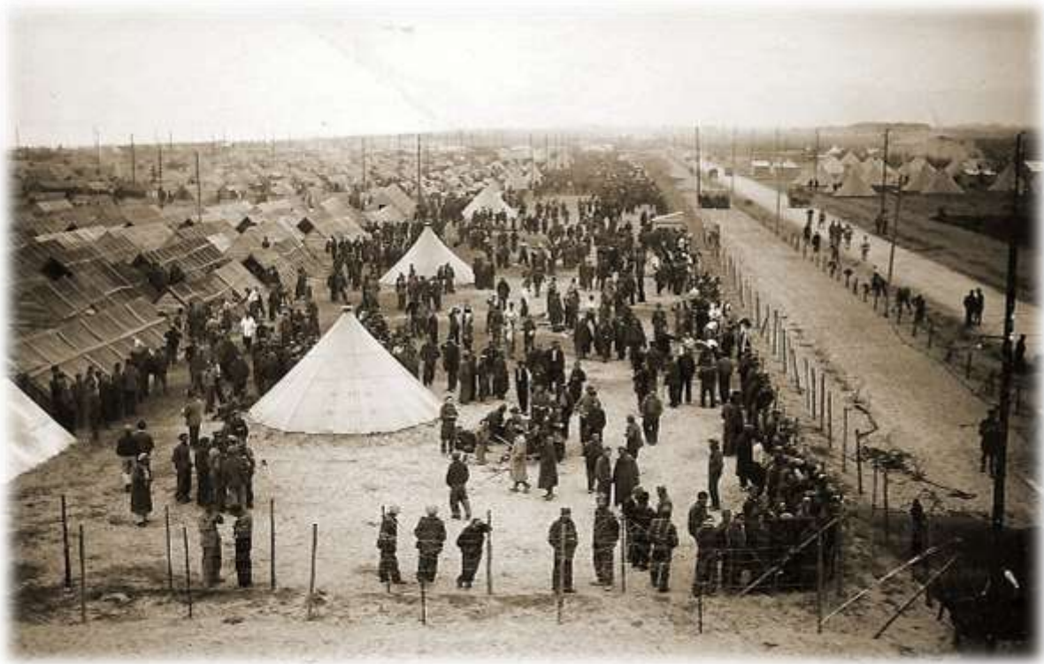
Het interneringskamp van Barcarès in 1939.

De levensomstandigheden in het kamp van Le Barcarès zijn ronduit rampzalig. Het kamp zit vol vlooiën en muggen en de Belgen zitten met de handen in het haar wanneer grote groepen militairen zich ziek melden.