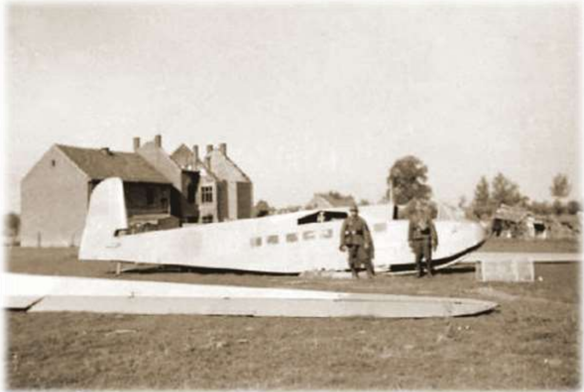
Duits DFS2320 zweefvliegtuig aan de Bilzerbaan op 11 mei.