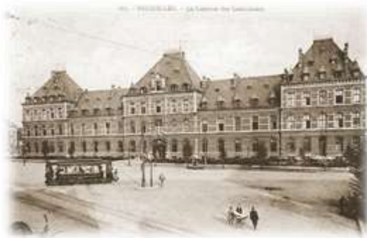
Kwartier Prins Boudewijn aan het Daillyplein te Schaarbeek