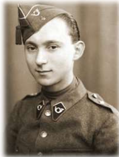
Studioportret van een milicien van de klas 40 van het 4de Regiment Carabiniers.