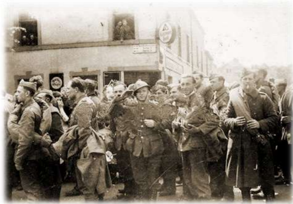
Gevangenen van het 2de Carabiniers nabij Aken.