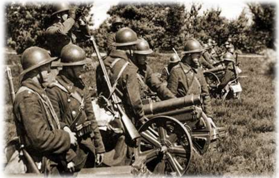
Karabiniers van de 15de compagnie met mortieren M76 (prentkaart uit 1939).

Omstreeks 01u20 passeert de 1ste Compagnie van het 7de Bataljon Genie de brug van Eindhout. De compagnie is op de terugweg van zijn vernielingsopdrachten ten noorden van het Albertkanaal en vervoegt zijn kantonnement te Veerle. Even later komt een ook een detachement van het 24ste Bataljon Genie voorbij. De bruggen van Eindhout en Veedijk worden ook gebruikt door duizenden vluchtende burgers die naar het binnenland willen ontkomen.