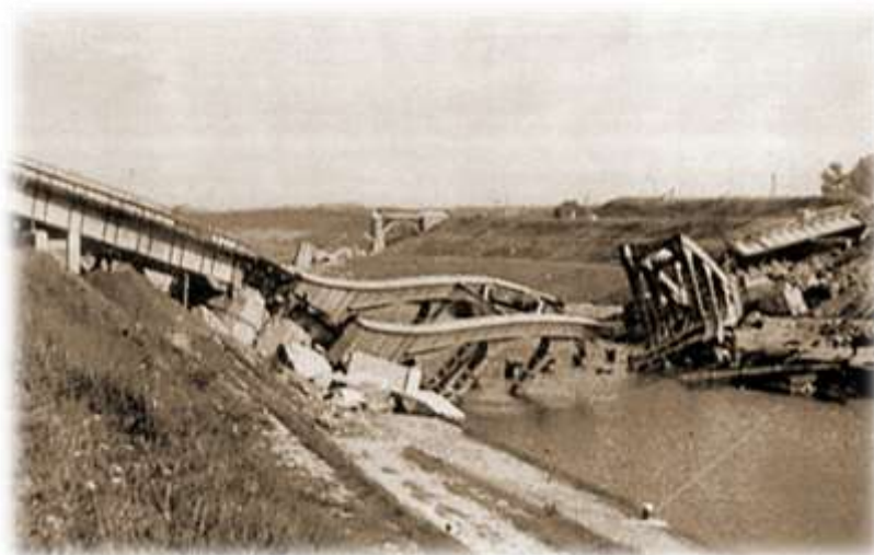
Door het vernielingsdetachement van 6Gn vernielde bruggen te Gellik